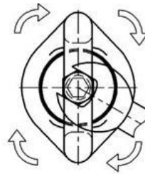
図 2. 締め付け作業中の状態 (上から見た図)